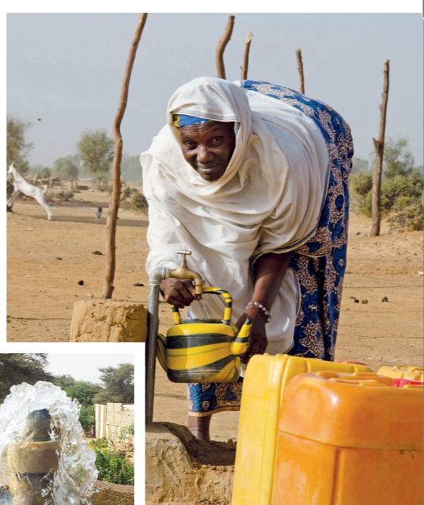
Accès par branchement particulier en Mauritanie.